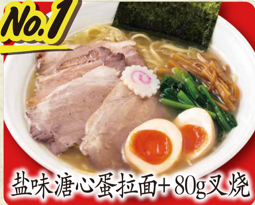
盐味溏心蛋拉面+80g叉烧