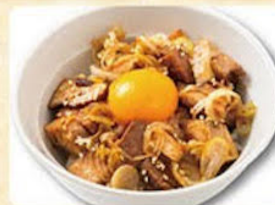
チャーシュー丼 350円

当店のお米は魚沼産こしひかりを使用しております。お茶漬けご飯はチャーシューをたっぷり乗せた贅沢なお茶漬け専用ご飯です。ラーメンのスープをかけてお召し上がりください。