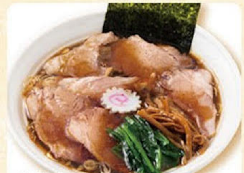
醤油チャーシューメン