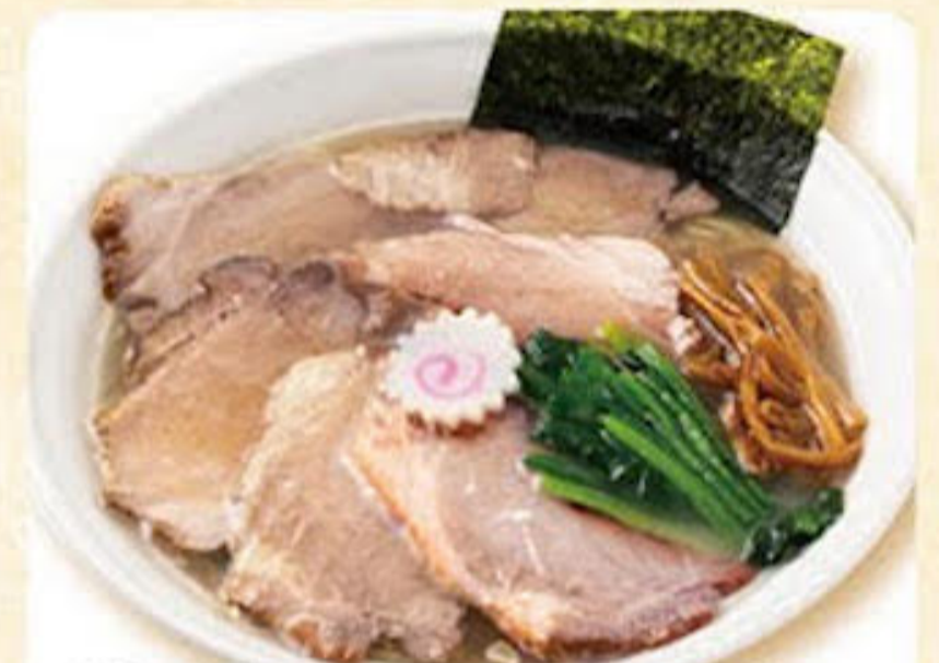
塩チャーシューメン