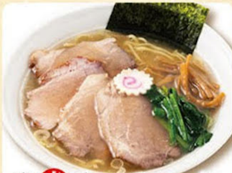
塩半チャーシューメン