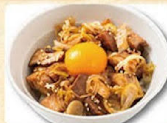
チャーシュー丼 350円

当店のお米は魚沼産こしひかりを使用しております。お茶漬けご飯はチャーシューをたっぷり乗せた贅沢なお茶漬け専用ご飯です。ラーメンのスープをかけてお召し上がりください。