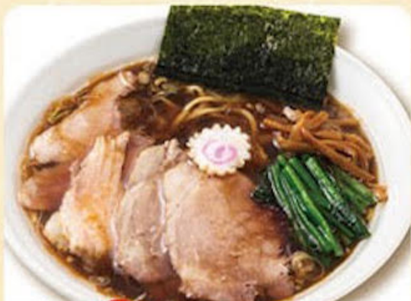
醤油半チャーシューメン