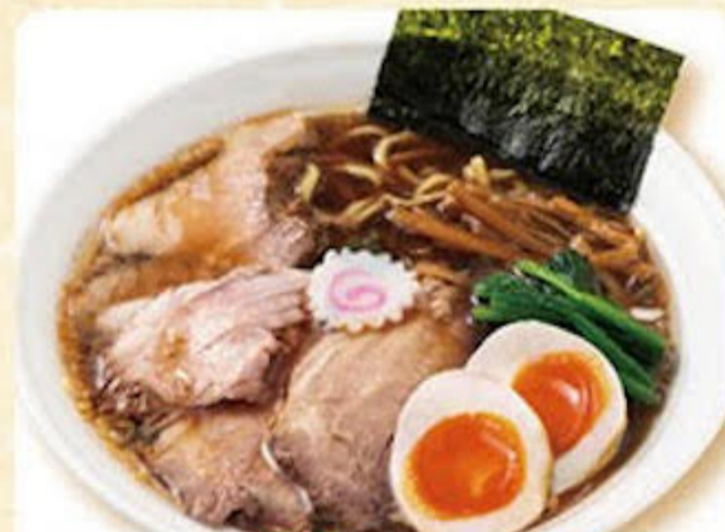
味玉醤油半チャーシューメン