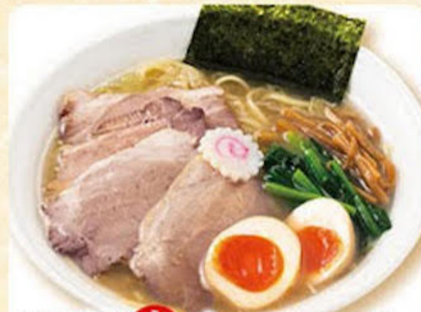
味玉塩半チャーシューメン