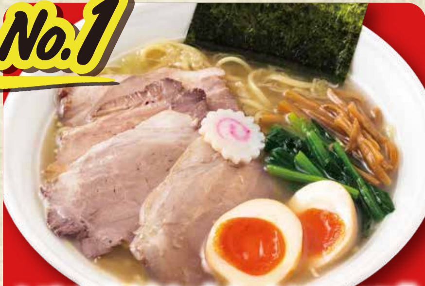
소금 라멘 (삶은 달걀, 차슈 80g 토핑)