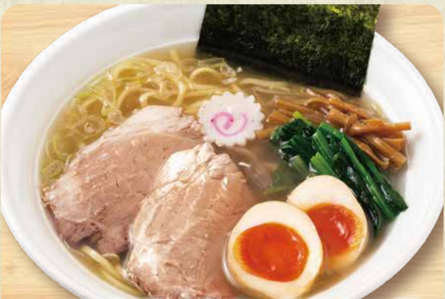
소금 라멘 (삶은 달걀 토핑)