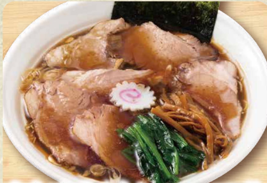
간장 라멘 (차슈 120g 토핑)