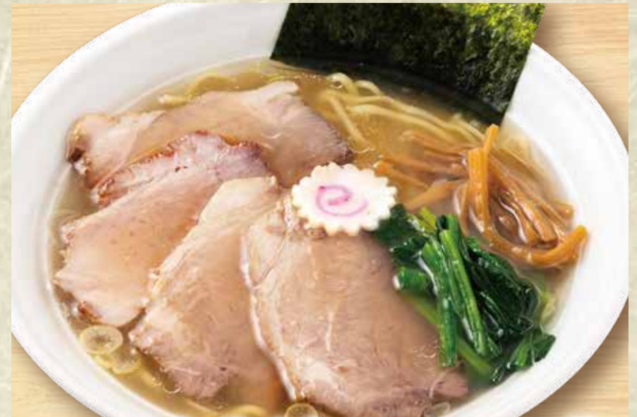
소금 라멘 (차슈 80g 토핑)