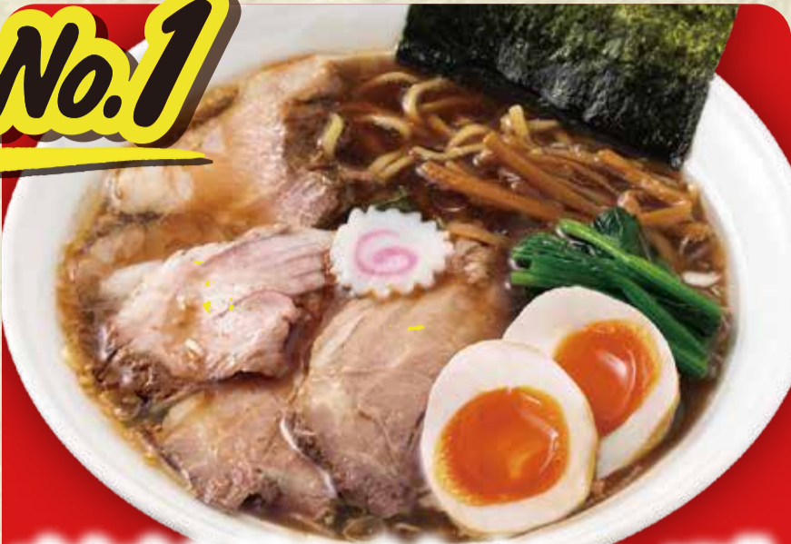
간장 라멘 (삶은 달걀, 차슈 80g 토핑)