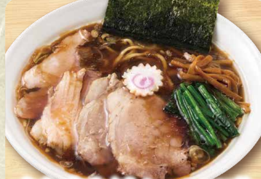
간장 라멘 (차슈 80g 토핑)