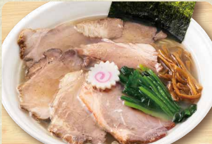
소금 라멘 (차슈 120g 토핑)