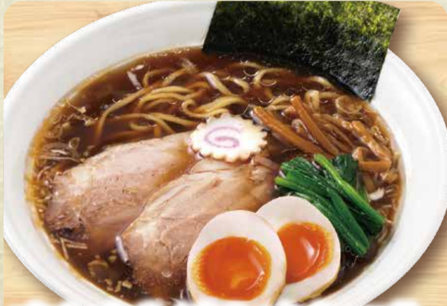
간장 라멘 (삶은 달걀 토핑)