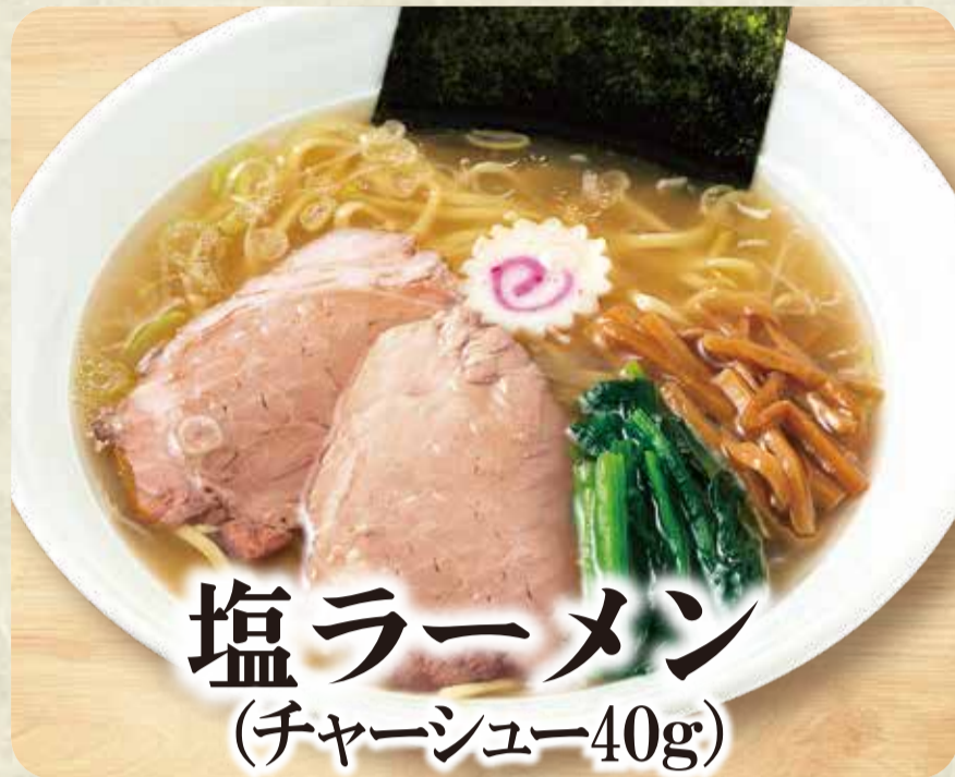
塩ラーメン (チャーシュー40g)