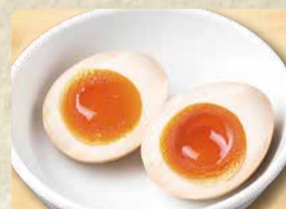
味玉 (マキシマム) (こいたまご) 100円