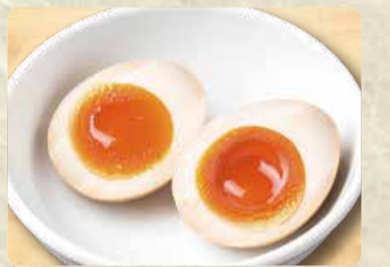
味玉 (マキシマム こいたまご) 100円