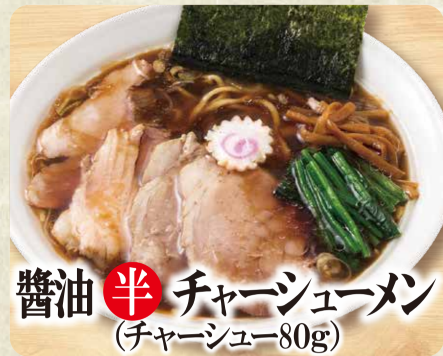
醤油半チャーシューメン (チャーシュー80g)