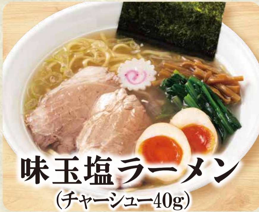
味玉塩ラーメン (チャーシュー40g)