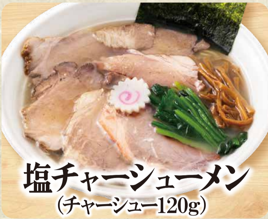
塩チャーシューメン (チャーシュー120g)