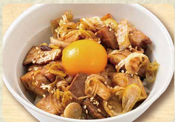
チャーシュー丼 350円

魚沼産こしひかりを使用しております。お茶漬けご飯は ラーメンのスープをかけて、お召し上がりください。