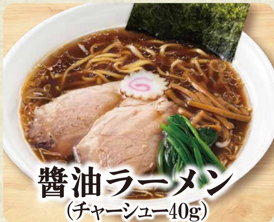
醤油ラーメン (チャーシュー40g)