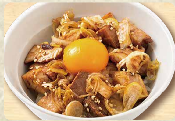
チャーシュー丼 350円

魚沼産こしひかりを使用しております。お茶漬けご飯はラーメンのスープをかけて、お召し上がりください。