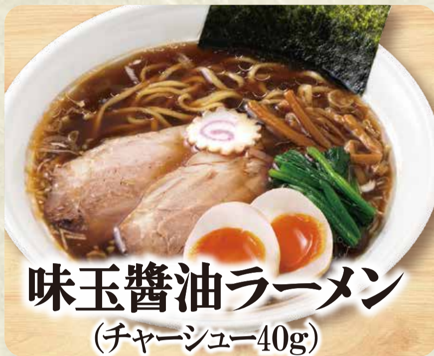
味玉醤油ラーメン (チャーシュー40g)