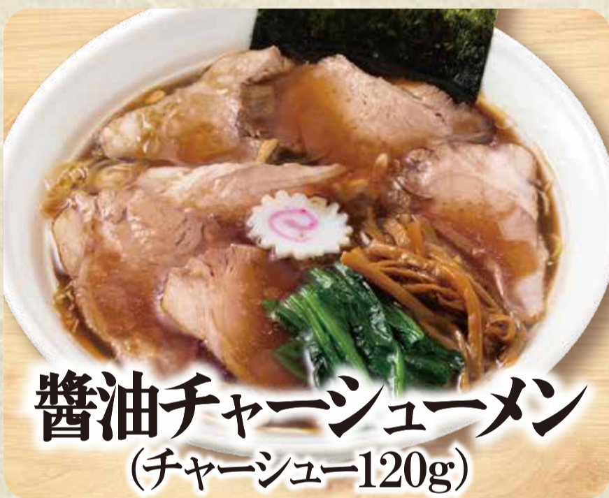
醤油チャーシューメン (チャーシュー120g)