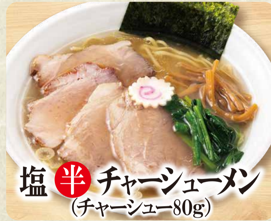
塩 半 チャーシューメン (チャーシュー80g)