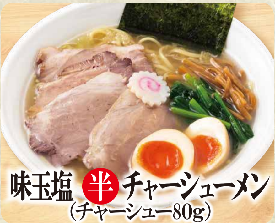
味玉塩 半 チャーシューメン (チャーシュー80g)