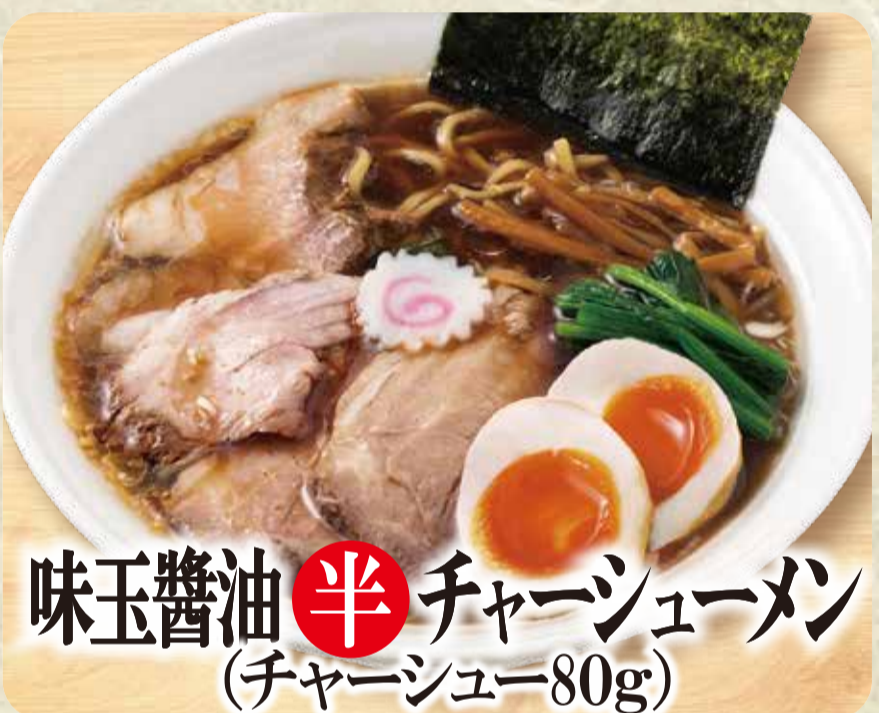
味玉醤油半チャーシューメン (チャーシュー80g)