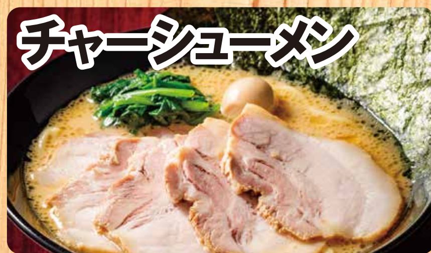
チャーシューメン